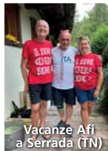
Vacanze Afi a Serrada (TN)