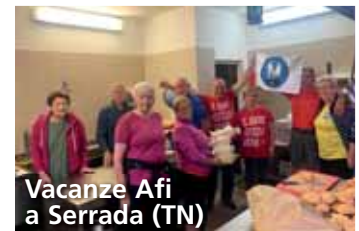
Vacanze Afi a Serrada (TN)

Stiamo infine avviando un nuovo progetto "La famiglia: la più grande delle Avventure", ma non voglio spoilerare troppo e vi lascio all'articolo di Roberto Orizio per gli approfondimenti!