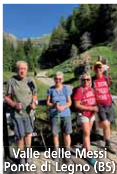
Valle delle Messi Ponte di Legno (BS)

Tramite dei workshop, laboratori interattivi per adulti e ragazzi, una cena a "chilometrozero" e uno spettacolo teatrale , da gennaio a maggio 2024 allargheremo lo sguardo, in modo anche leggero, sulle sfide odierne