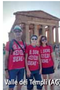
Valle dei Templi (AG)