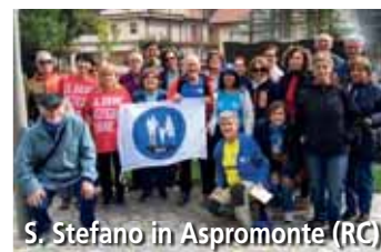
S. Stefano in Aspromonte (RC)