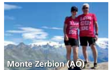
Monte Zerbion (AO)