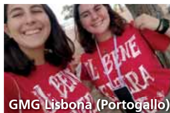
GMG Lisbona (Portogallo)