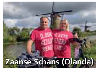
Zaanse Schans (Olanda)

Insomma, tanta carne al fuoco... Vi diamo appuntamento al 2024 per il racconto del BENE che speriamo di generare con questi eventi.