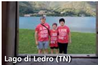
Lago di Ledro (TN)