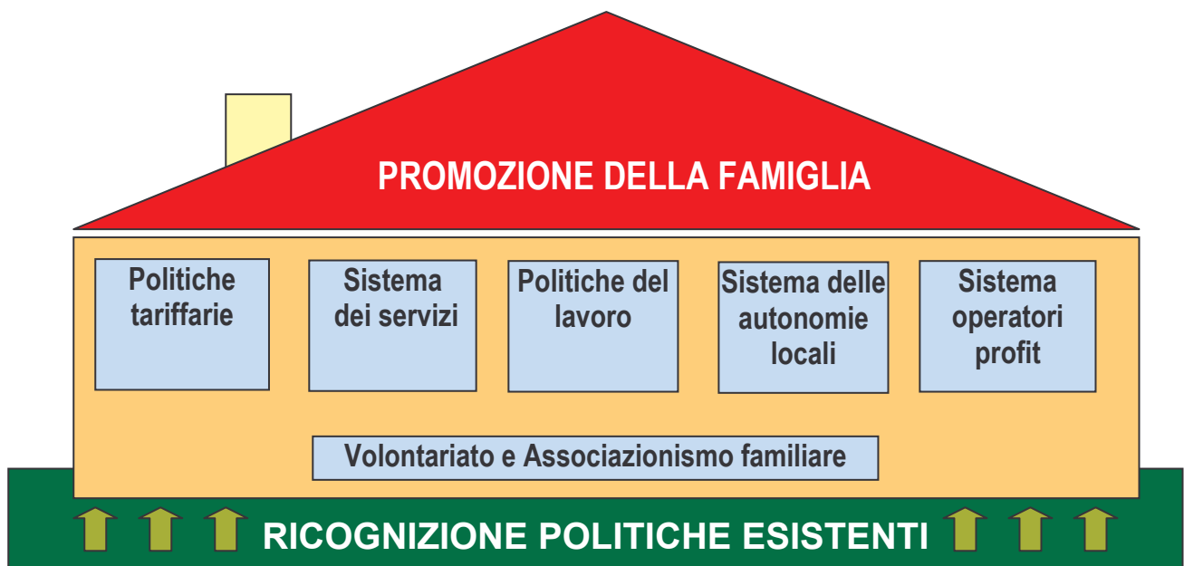
Figura n. 3 “La promozione della famiglia”